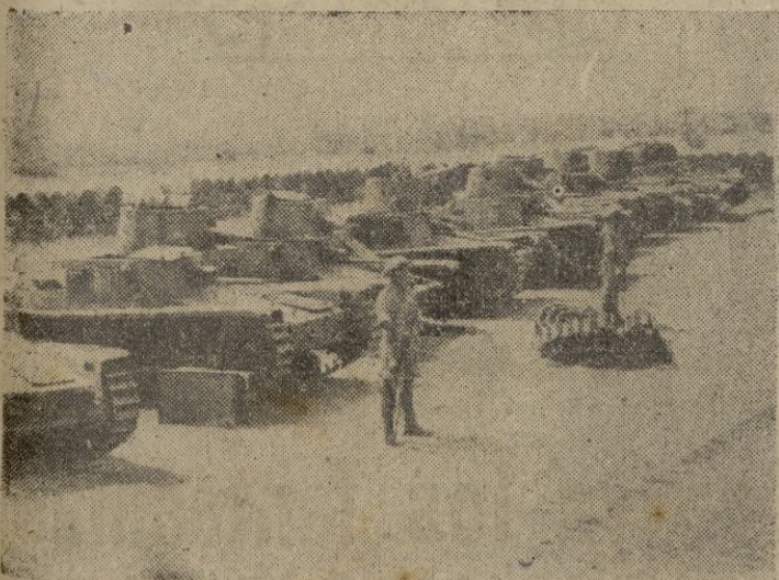
Tropas acorazadas inglesas se encuentran estacionadas en el Irak, en previsión de cualquier eventualidad