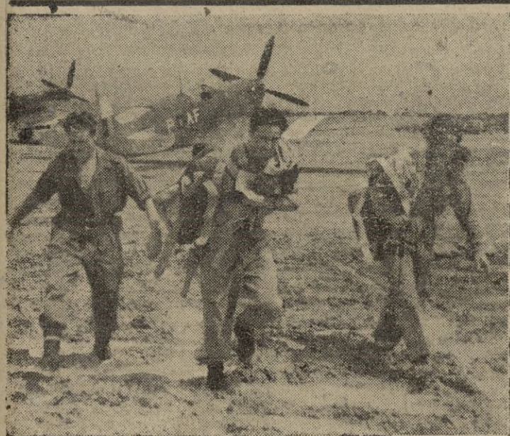
Ante la postura persa, los británicos han tomado medidas para evitar ataques en el Medio Oriente. En la fotografía, una escuadrilla de caza de la RAF, aterriza en un aeródromo del Irak, para engrosar las fuerzas aéreas inglesas en aquella zona, que actualmente se calculan en unos 400 aparatos.

El día de ayer fué empleado por Mossadeq en preparar (Pasa a la página 8.)