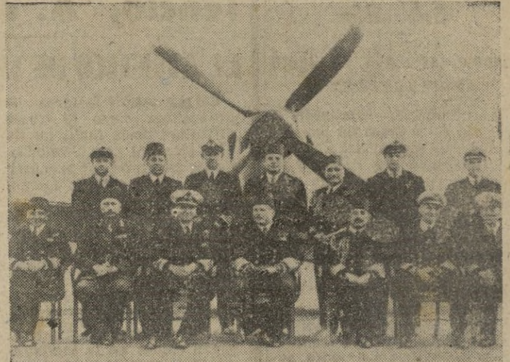
Las posturas de los ingleses en Persia, ya no es la misma de antaño. Finalizado su dominio en la India, independizada Palestina, y un tanto tirantes las relaciones con Egipto, la postura británica es muy difícil en el Oriente Medio. En la fotografía se ve al rey Faruk, departiendo amistosamente con miembros del Alto Estado Mayor Naval inglés del Mediterráneo. Pese a esta reunión, las relaciones entre Inglaterra y Egipto, son hoy muy irregulares.

Pasando el tiempo, y a pesar de que las sumas que se derivaban de ese famoso 16 por 100, engrosaban notablemente las exhaustas cajas del Estado iraníes, los persas observaron con mucha claridad que los ingresos que como producto de la explotación del petróleo entraban en su Caja estatal, no aumentaban en la proporción en que lo hacía la exportación de la nafta nacional. ¿Cómo hablan de expli-