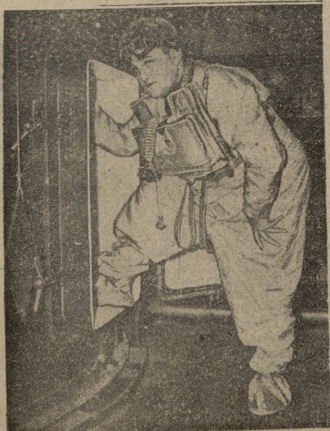
Los pilotos para aviones a reacción llevan uniformes especiales y son probados en cámaras supersónicas para acreditar su capacidad física.

El dominio espiritual del Sevilla. - El partido al reloj (Amplia información en páginas 4 y 5.)