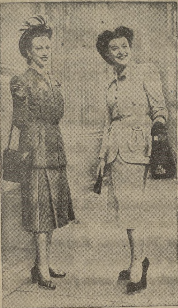
La mujer, completamente al margen de los dramáticos acontecimientos del momento mundial cuando se está tratando de trapos. A la vista dos de los modelos para otoño presentados en Londres en los últimos días.

Turquía negocia hábilmente ahora. España... ¡Ah! España está a un lado y acaso sea el suyo el secreto de la victoria.