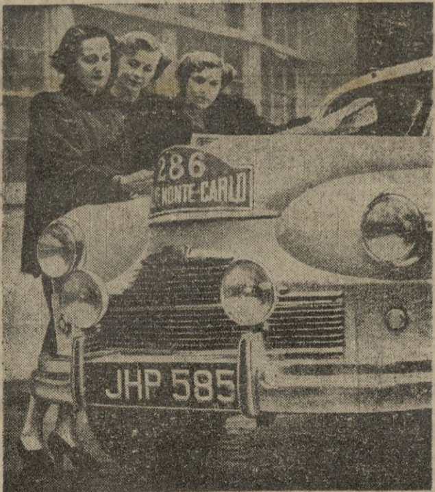
El Rayle de Montecarlo, es a prueba mitad deporte, mitad “snobismo”, constituye el centro de la atención de todo género de personas. Aquí vemos a tres elegantes damas contemplando uno de los coches participantes, como pretexto para ser fotografiadas.

Se confía en que las naciones occidentales europeas (Pasa a la página 8.)