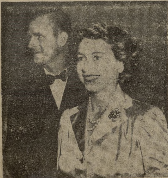
La princesa Isabel y el duque de Edimburgo, fotografiados a su llegada al Canadá.—(Foto Calpe).

Washington, 18.—En contestación a la nota soviética divulgada por la Agencia «Tass» en la que se dice que las relaciones entre Estados Unidos y Rusia no pueden ser peores, el Departamento de Estado ha facilitado otra nota en la que se condena la respuesta soviética, que se califica de «explosión de propaganda», porque la Unión Soviética ha publicado su parte de las conversaciones hasta ahora secretas, mientras que los Estados Unidos continuaban manteniéndolas en reserva. (Pasa a la página 6.)