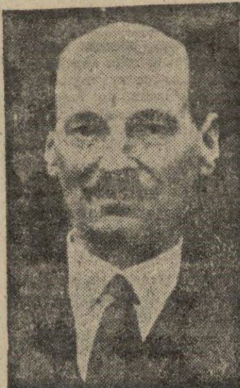
Mr. Attlee, actual premier británico, bajo cuyo Gobierno celebrará Inglaterra las elecciones más emocionantes de su vida política

El partido laborista está minuciosamente organizado y fuertemente disciplinado. En su constitución no se da lugar a la dirección individual. Está compuesto de uniones de varias organizaciones, tales como los sindicatos, organizaciones económicas, sociedades (Pasa a la página 8.)