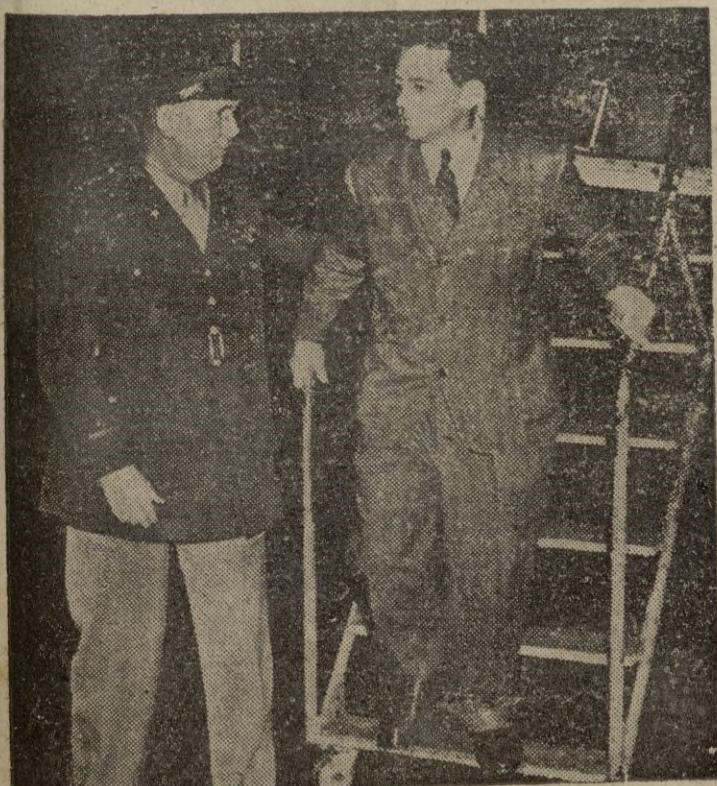
La reciente visita del general Omar Bradley a Turquía está estrechamente unida a la grave situación porque atraviesa el Oriente Medio y a los planes de defensa de Occidente en aquella zona vital.