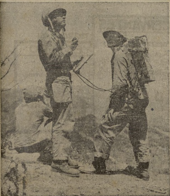
Fusileros de Marina de los Estados Unidos establecen contacto por radio con los aviones aliados en Corea.