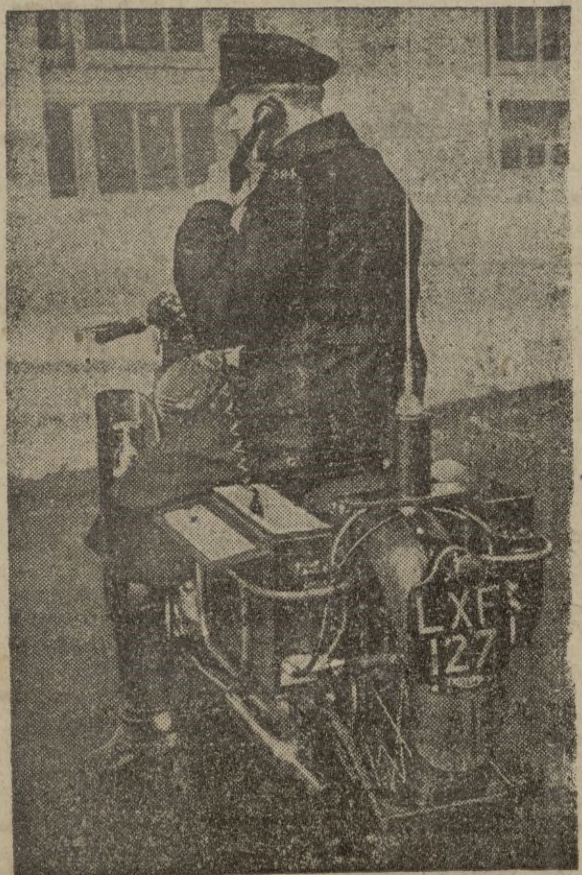
He aquí un modelo de motocicleta equipado con radio y todos los elementos precisos para cumplir el policía su misión de perseguir al delincuente.

Se sabe que esta refinería, que será la mayor de Europa, debe ser inaugurada el próximo día 14, por el primer ministro Attlee.