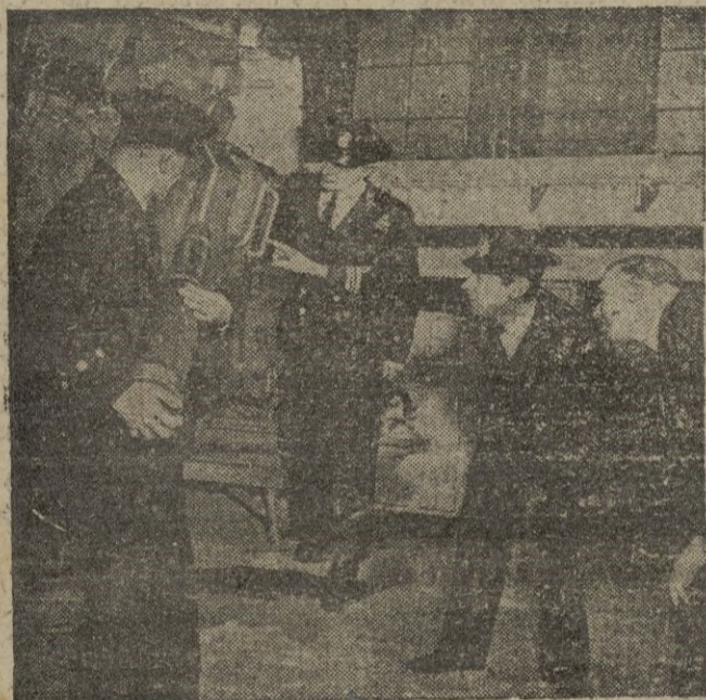
Oficiales de la Marina británica examinan modernos cañones especiales para artillería de costa.